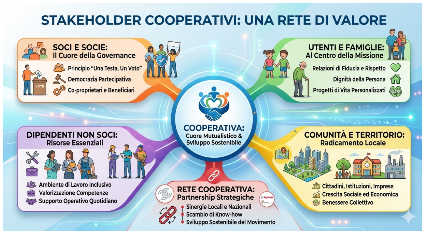
Immagine mappa degli Stakeholder

nostro bilancio. È grazie a questa interconnessione che la nostra Cooperativa riesce a trasformare la gestione dei servizi in un progetto di sviluppo sostenibile e benessere collettivo .